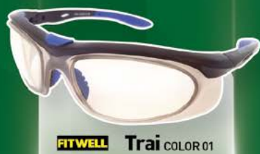
FITWELL Trai COLOR 01