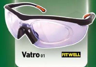
Vatro 01 FITWELL