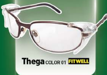
Thega COLOR 01 FITWELL