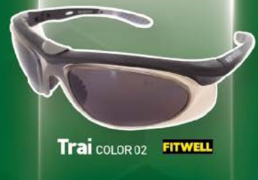
Trai COLOR 02 FITWELL