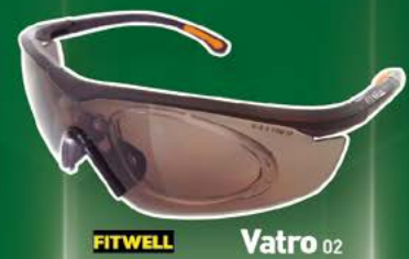
FITWELL Vatro 02