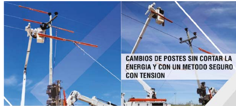
CAMBIOS DE POSTES SIN CORTAR LA ENERGÍA Y CON UN METODO SEGURO CON TENSION

de referencia con pisos y techos, con el objetivo de brindar previsibilidad tanto a la empresa como al Estado provincial. La iniciativa quedó vinculada al futuro complejo exportador de GNL y al crecimiento de la producción proveniente de Vaca Muerta. En ese marco, YPF deberá comunicar en un plazo máximo de 24 meses la decisión final de inversión y la obtención del financiamiento internacional necesario para avanzar con el proyecto.