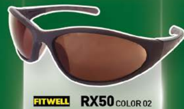
FITWELL RX50 COLOR 02