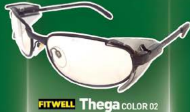
FITWELL Thega COLOR 02